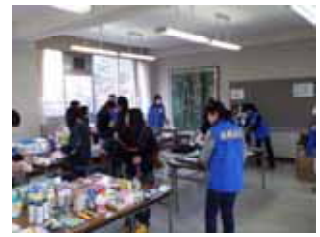
P T A バザー 出店