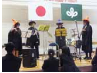
ステージ発表 (正体は?)