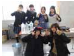
模擬店での一コマ