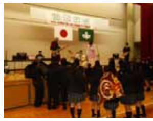
ステージ発表 (軽音部)